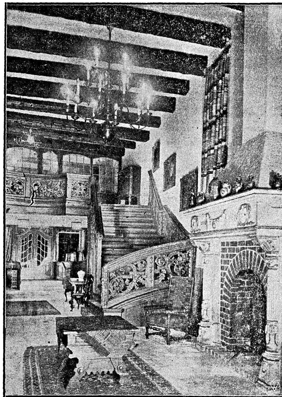
Links: Das Aeußere der ehem. von Kapfischen Häuser in der Martinistraße in Bremen, in denen die Handweberei Hohenhagen ihr neues glänzendes Heim gefunden hat. Oben: Das Innere der geschmackvollen Ausstellungsräume.