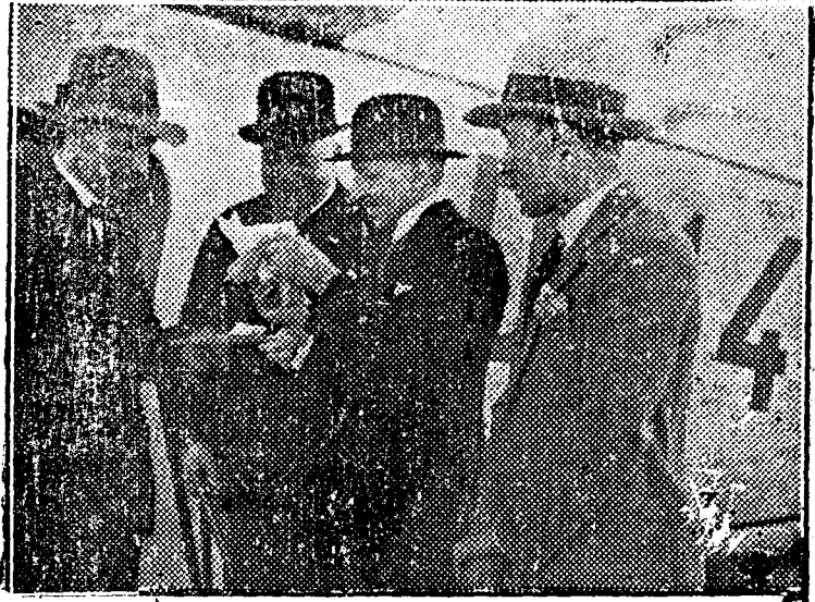
Министра на жельзници гъ г. Стайновъ и г. Розелиусъ предъ аероплана.

ТЪРЖЕСТВЕНТО ПРИЕМАНЕ АПАРАТА. — ДАРЪТЪ НА г. РОЗЕЛИУСЪ ЗА ПРИЮТА НА НЕДЖГАВИТЪ.