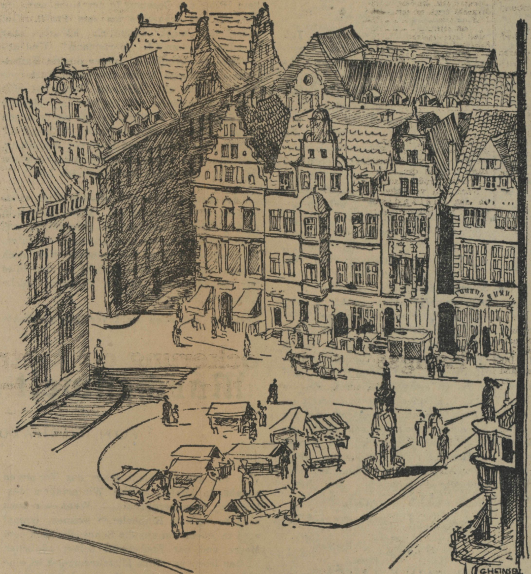
DER BREMER MARKTPLATZ

Und du siehst manchen der Frachtdampfer weserabwärts ziehen nach Bremerhaven, dem Salzwasser entgegen. Schon hier begleiten sie