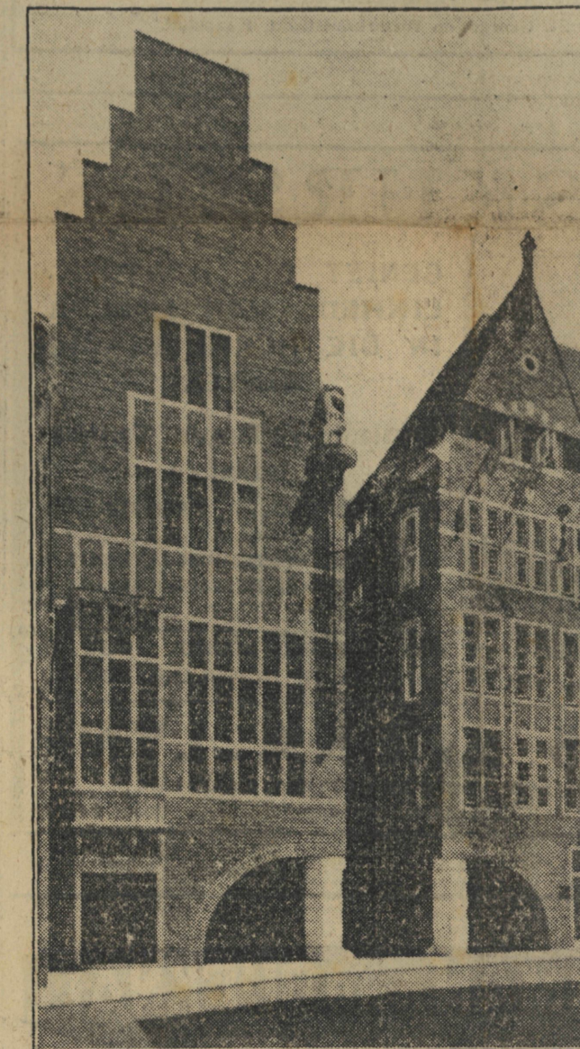
Die Robinson Crusoe-huis

En dan staan ons skielik voor 'n... ja, wat op aarde is dit? Naas 'n huis waarop die sterrebeelde se simbole afgebeeld is, sien ons 'n beeldwerk wat die vier verdiepings hoë gewel van bo tot onder in beslag neem. Dit lyk so fantasties, dat ons vir 'n oomblik geneig is om te dink dat 'n malmens hier aan die werk was. Maar ons ervaar dan dat hierdie beeldwerk van geweldige afmetings 'n getroue weergawe is van die ou Germaanse lewensboom, en